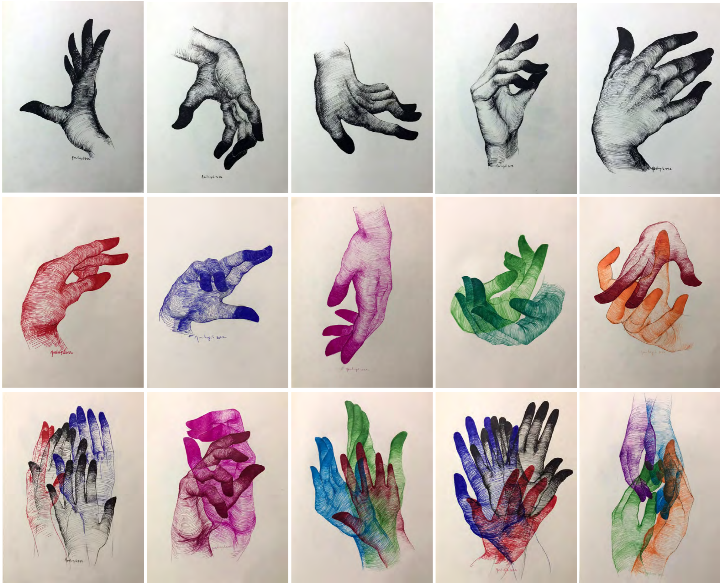
Eller Serisi, 87x105 cm, 2022, Kağıt üzerine renkli kalem