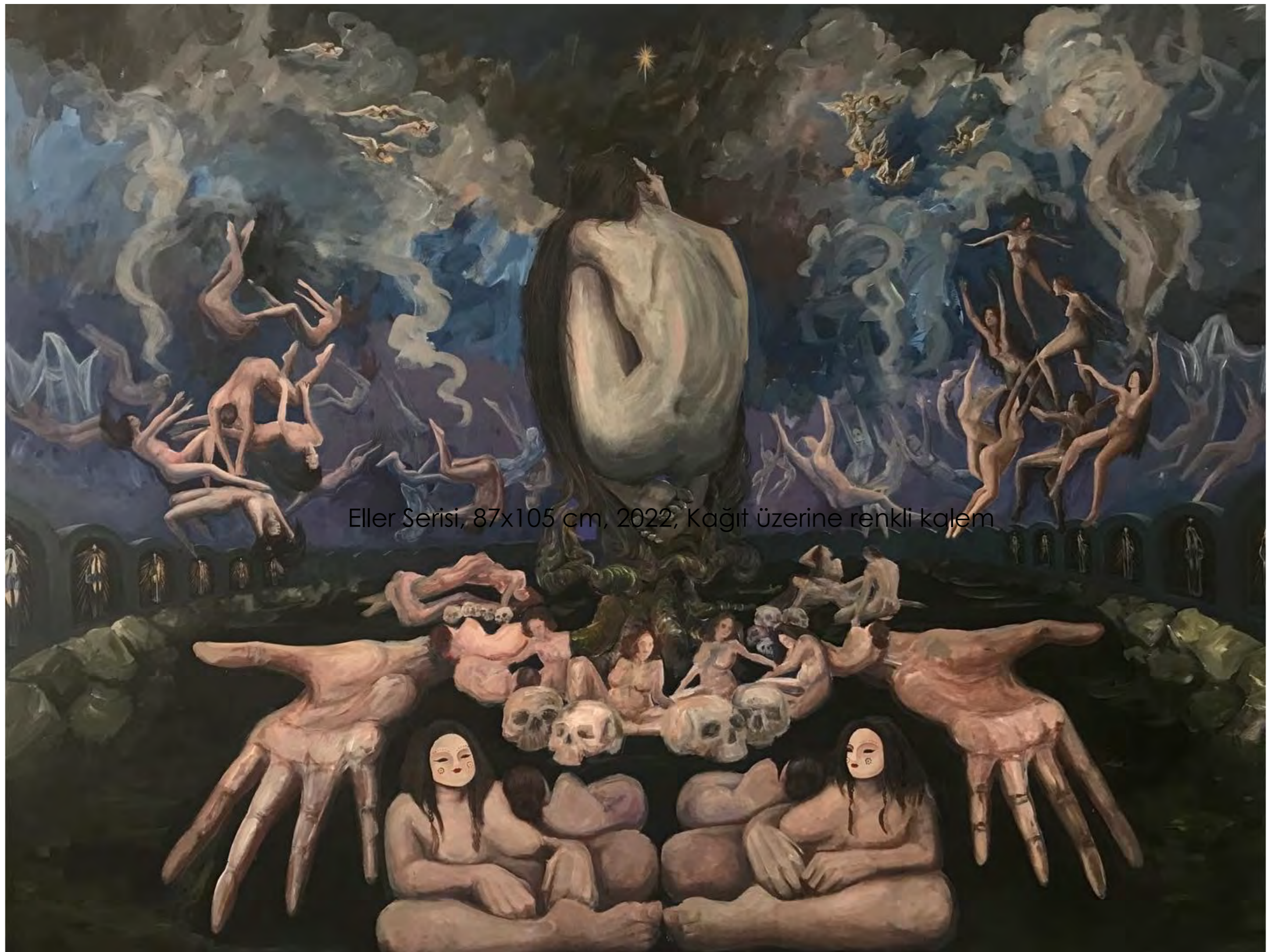
Eller Serisi, 87x105 cm, 2022, Kağıt üzerine renkli kalem