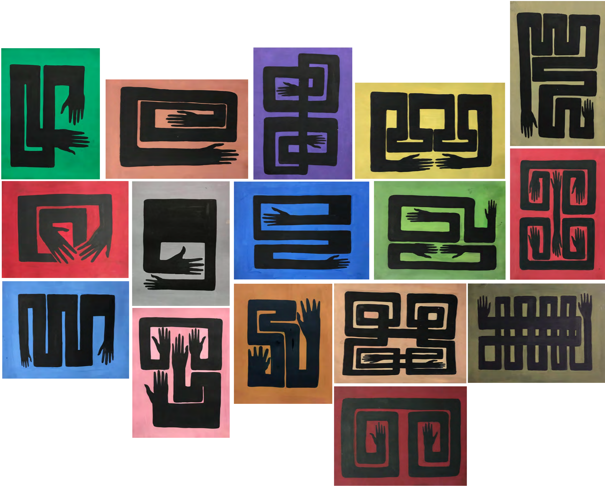
Renkler ve Eller , 2022, Bristol üzerine guaj boya