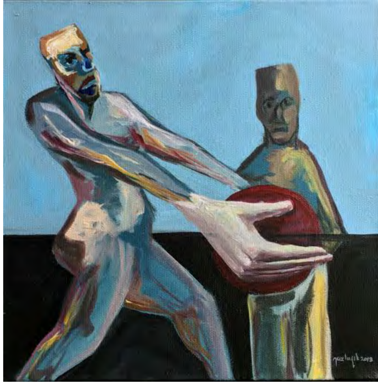
Sefiller, 25x 25 cm, 2019, Tuval üzerine akrilik boya