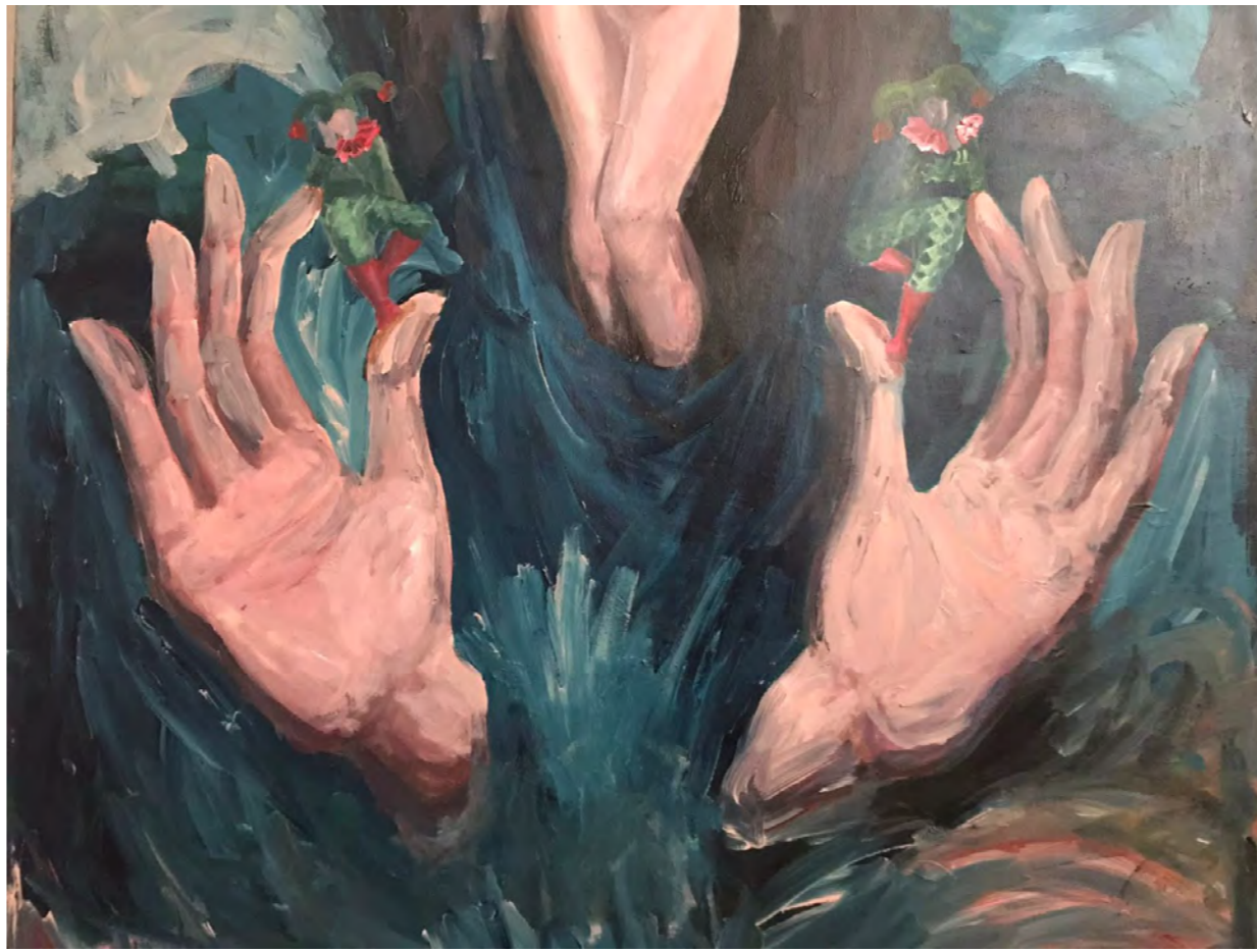
Danse Macabre No.2, 100x 100 cm, 2021, Tuvall zerine akrilik boya