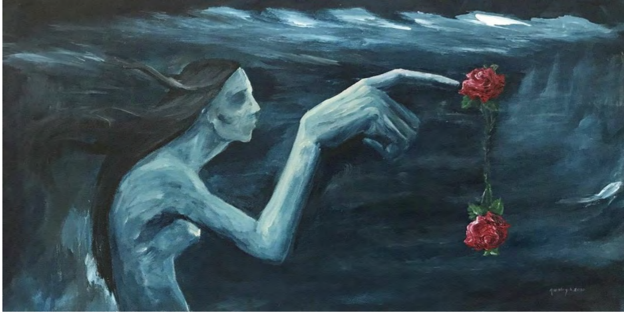
Ruh İkizi, 30x 60 cm, 2020, Tuval üzerine akrilik boya