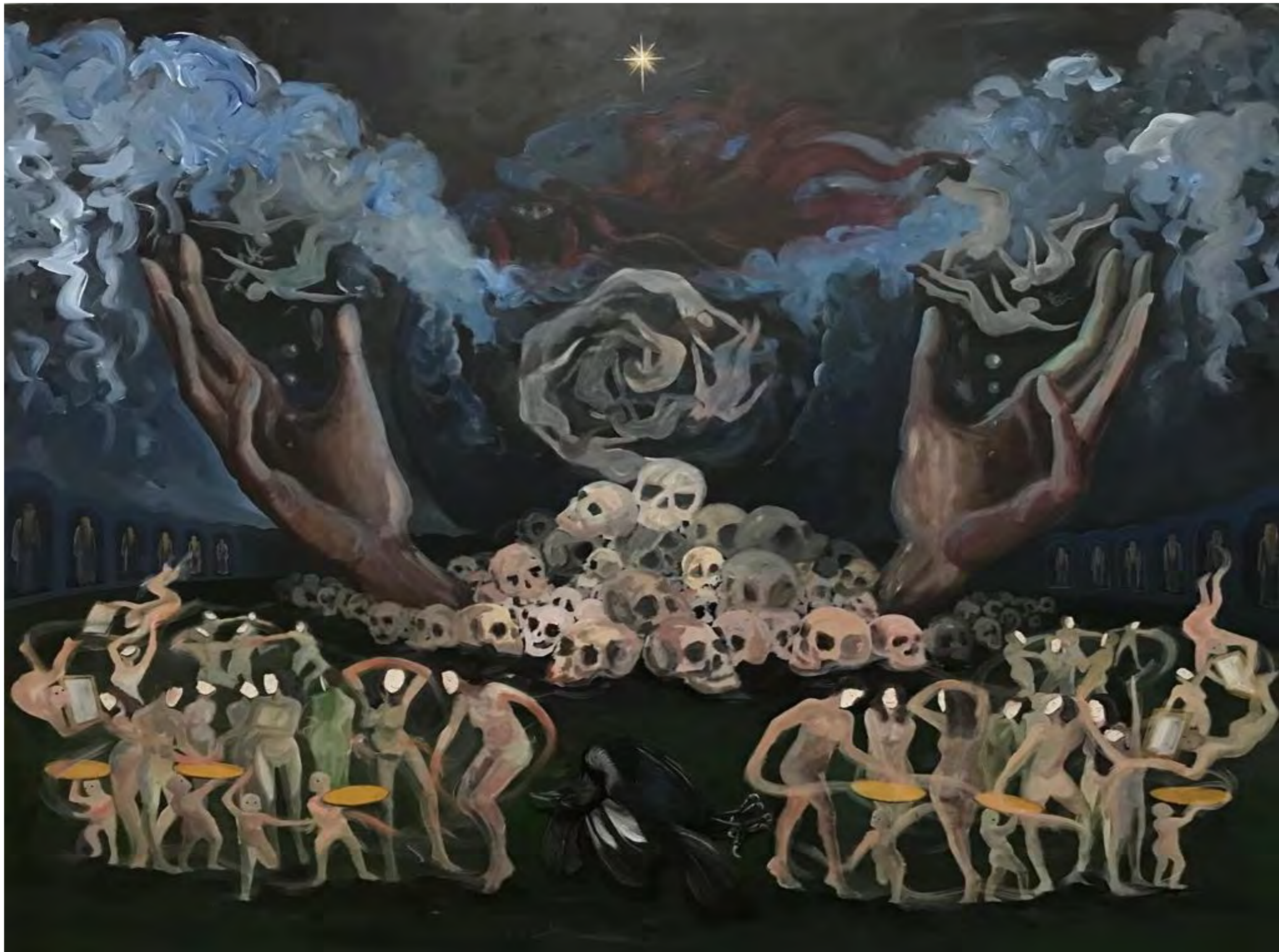
Gördüğüm Savaşlar II, 150x180 cm, 2022, Tuval üzerine akrilik boya