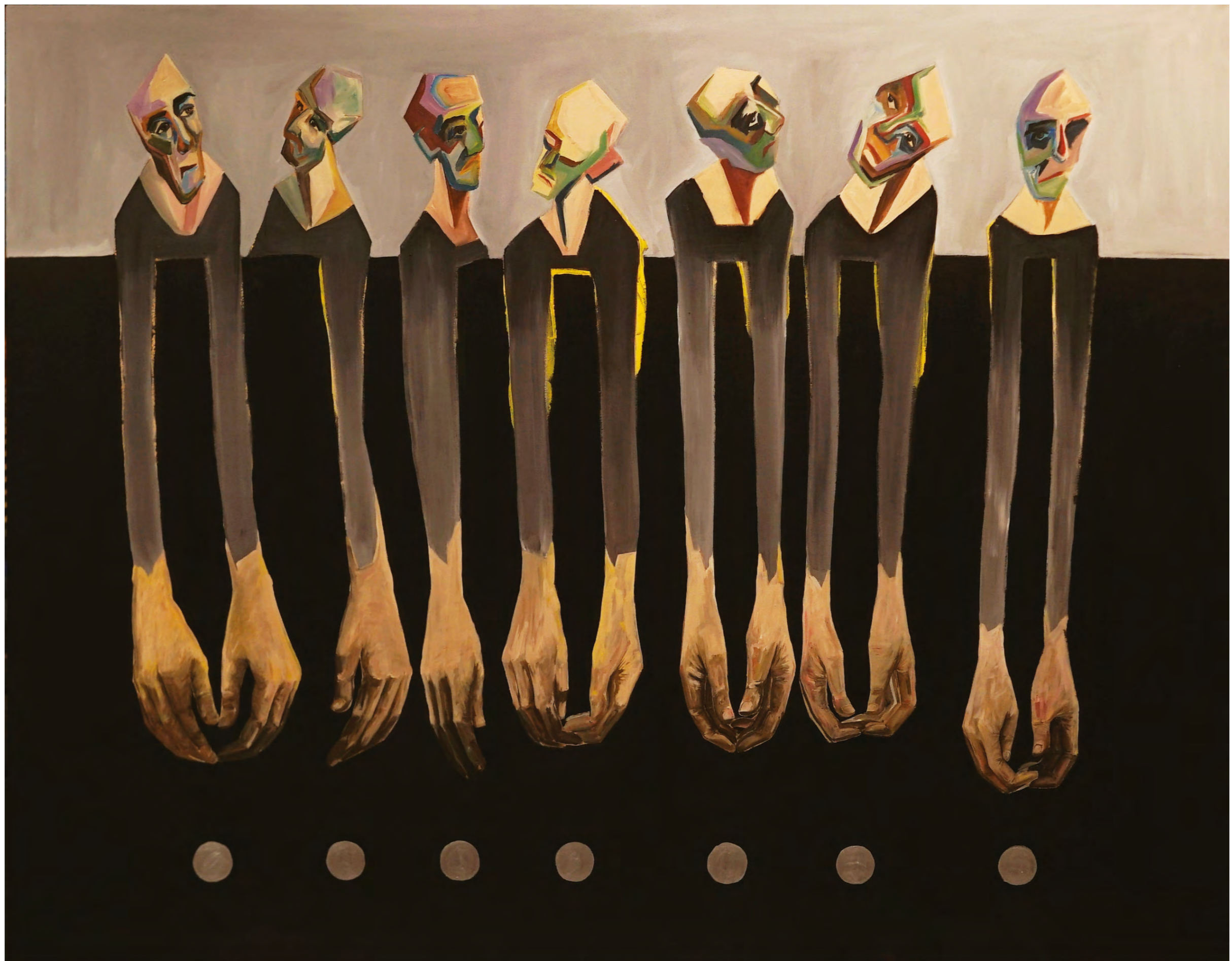
Sefiller, 150x 180 cm, 2019, Tuval üzerine akrilik boya, Private Collection