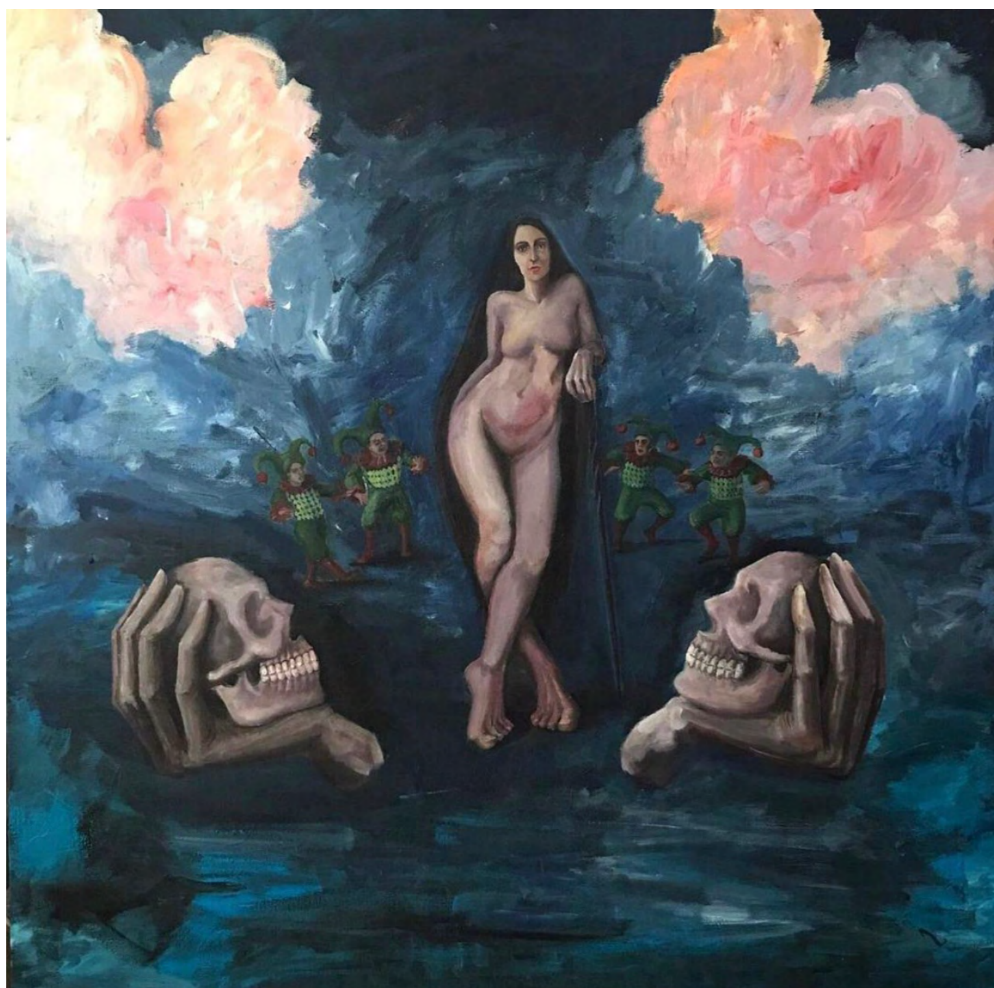
Danse Macabre No.2, 100x 100 cm, 2021, Tuval üzerine akrilik boya