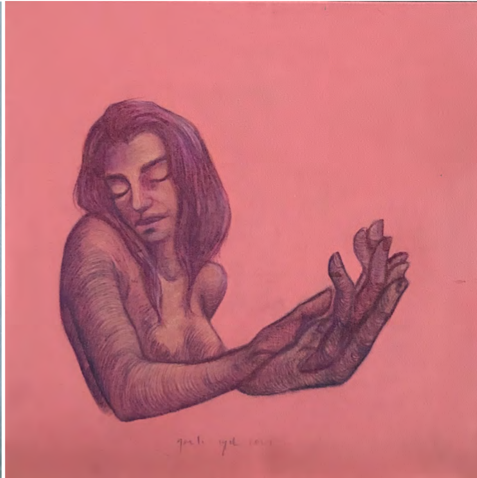
Kadın Serisi, 40x 40 cm, 2022 tuval üzerine akrilik boya